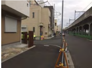
床屋の看板を左折