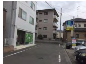
次の路地を左折で玄関があります。